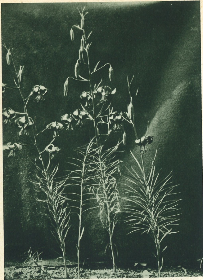
Lilium tenuifolium (= pumilum ).