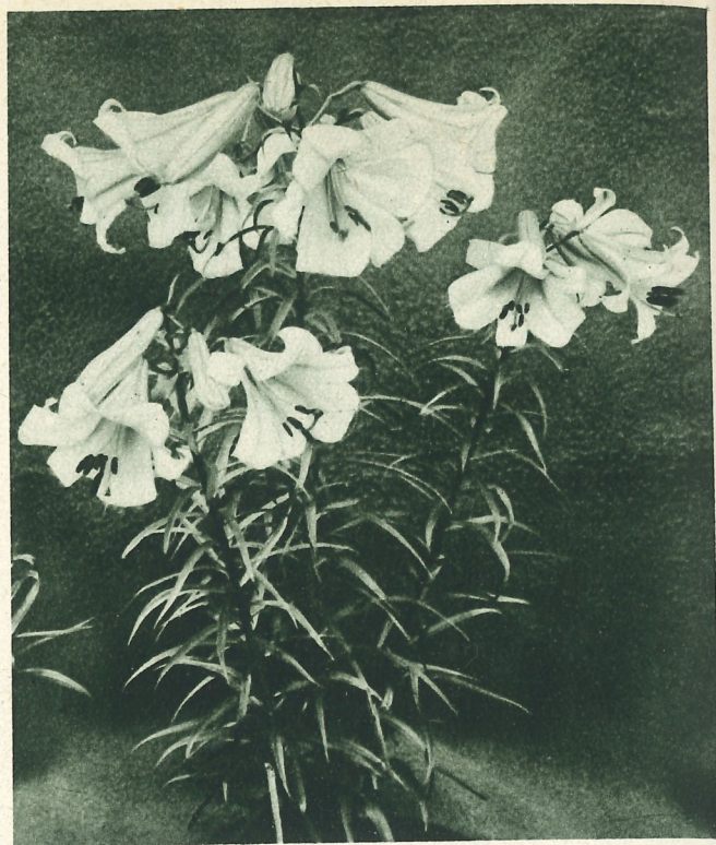
Lilium princeps G. C. Creelman.