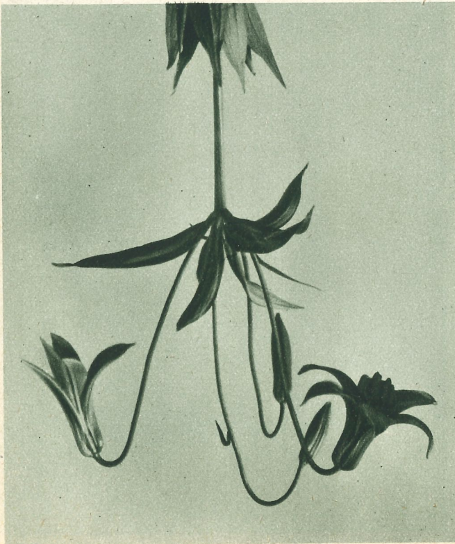
Allmän Svensk Trädgårdstidning

L. Maximowiczii och Willmottiae , är den utan jämförelse cm. djupt.