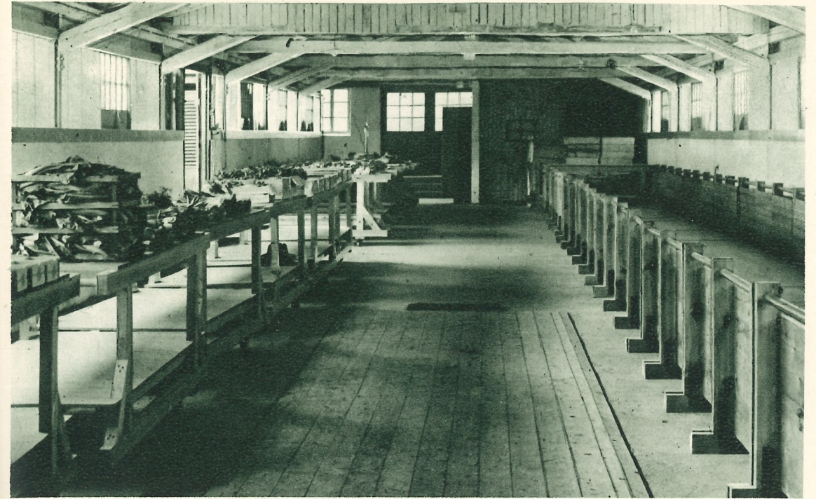
Förelisningsrummet i auktionshallen.