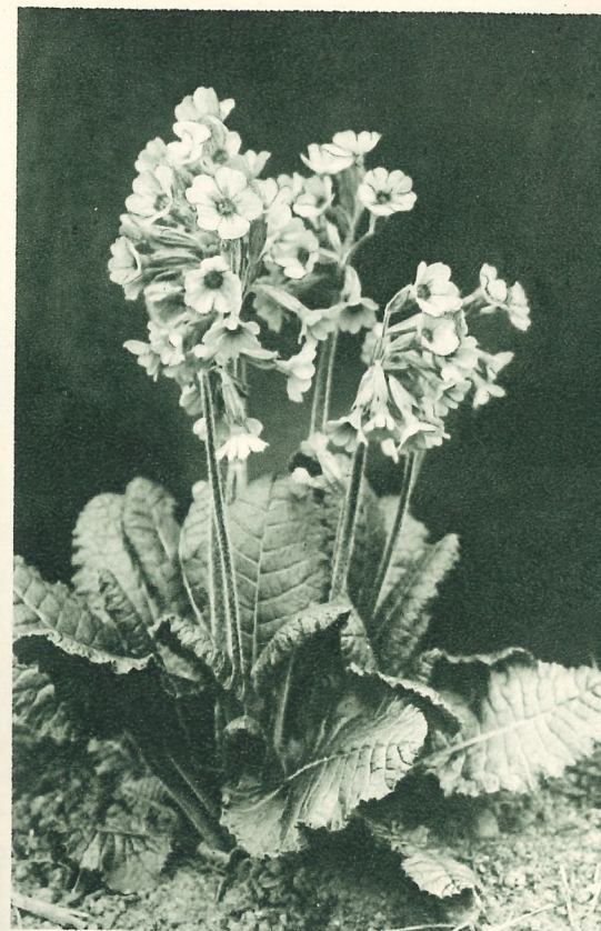
Primula elatior. Den äkta i Skåne vildväxande arten.

Från de båda föregående, som hava blommor i flock på hög stängel, skiljes den lätt, genom att de enblomstriga blomskäften utan någon gemensam stängel utgå direkt från bladrossetten. Då blomskäften äro ungefär av samma längd som bladen och jämförelsevis vecka, komma blommorna att på ett graciöst sätt vila på den låga kudde, bladrossetten bil-