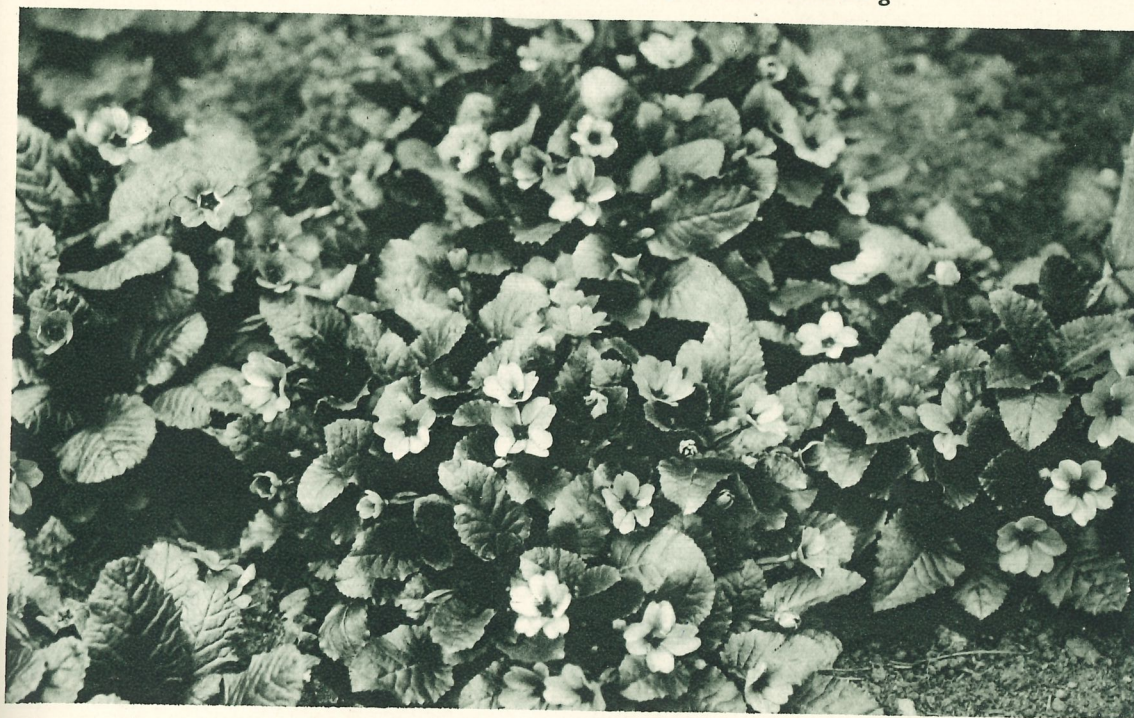
Primula Julia Purpurkissen (t. h.). P. Wanda (t. v.).

Några av de dubbla former förf. prövat uppräknas här i den ordning de visat sig härdiga: sulphurea plena, svavelgul; lilacina plena (double mauve), starkväxande, skär; alba plena, välformad, renvit; Marie Crousse, lilafärgad med vita kanter; Arthur Dumoullin, robust, blåviolett; sanguinea plena, även kallad