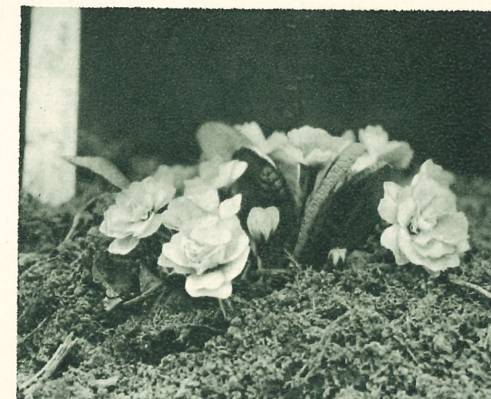
Primula acaulis sulphurea plena.

dar. Blommorna, som äro ännu större än hos storvivan, framkomma ofta oerhört rikt, och en och samma planta kan under gynnsamma vårar vara i blom nära två månader i sträck. Kulturformerna pläga dessutom oftast hava en blomningsperiod även under hösten.