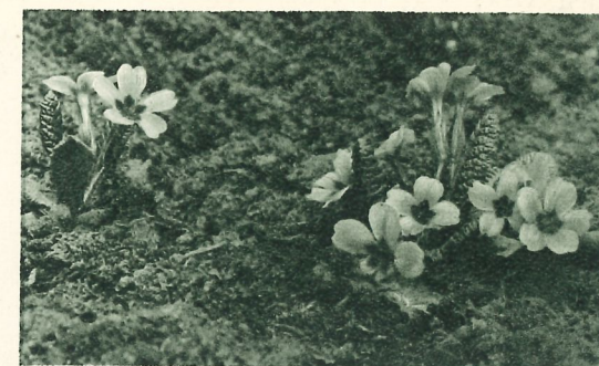
Primula acaulis. Den äkta vilda arten.